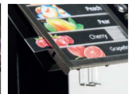
ESI (Easy slide in) labels